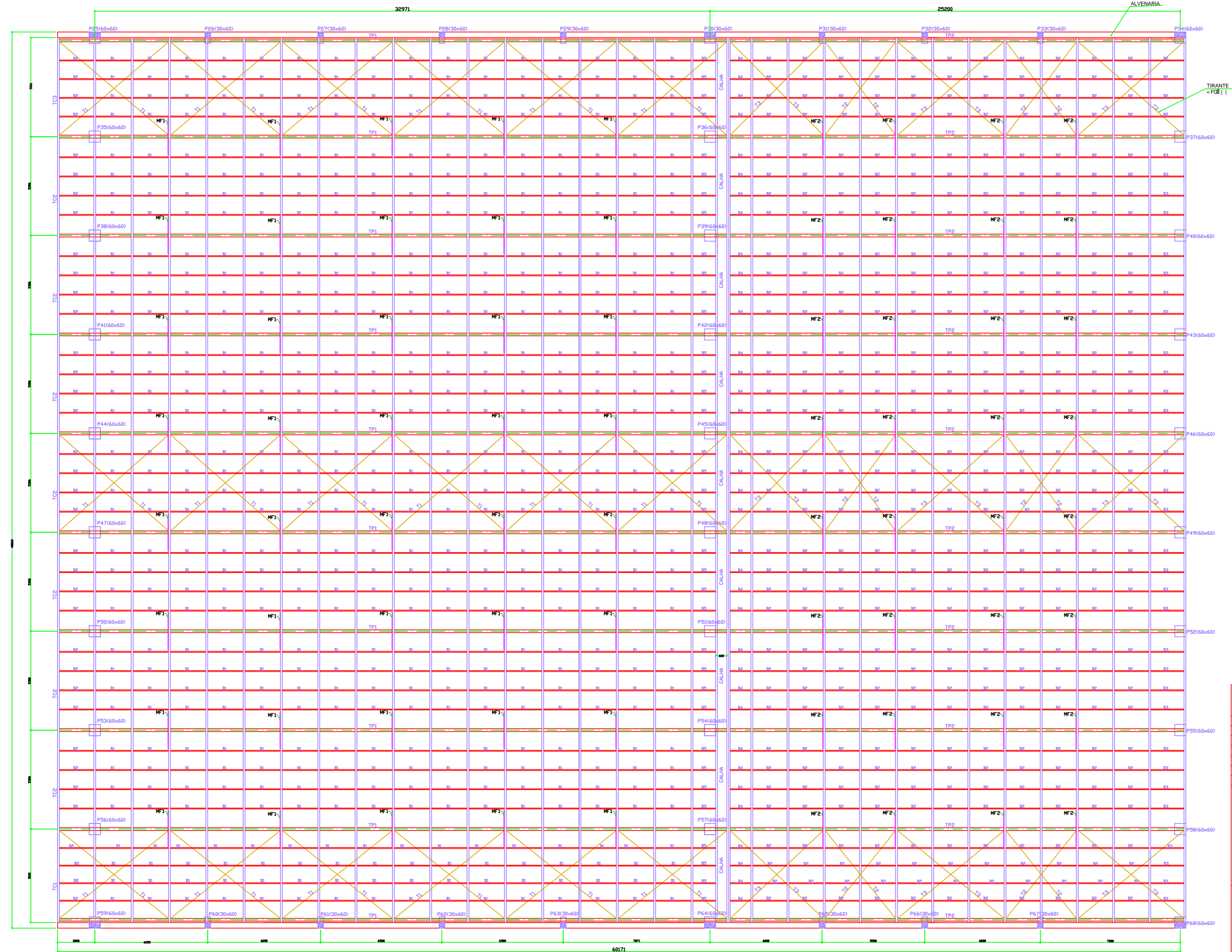
PLANTA DE MONTAGEM DE COBERTURA DO GINÁSIO ESC.1:75